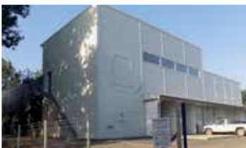
A szennyvíztelep és csatornahálózat korszerűsítése és bővítése

mintegy 1,2 milliárd forintos költséggel, pályázati támogatásból megvalósítottuk a szennyvíztelep és csatornahálózat korszerűsítését és bővítését , 3 alkalommal szerveztünk veszélyeshulladék-gyűjtést (a szelektív hulladékudvar megnyitásáig), 7 új fasort ültettünk, (Báthory u. (2014), Nagy Imre u. (2014), Templom sétány (2014), Városliget-sétány, Tavasz utca (2018), városi köztemető (2019), Nagy-tó körüli sétány (2019)) és meglévő fasorokat újítottunk meg (Báthory u., Gesztenye u., Budai Nagy Antal u., Vájár u., Alkotmány u.), öt év alatt összesen 296 darab fa elültetésével, 2,8 millió forint költséggel. Öt év alatt nagyságrendileg 300 m 3 illegális hulladékot gyűjtöttünk össze és szállítottunk lerakóba.