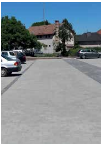
Puskin utca 8. udvara (2018)