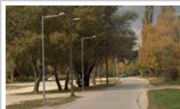
Városligeti sétány (2017)