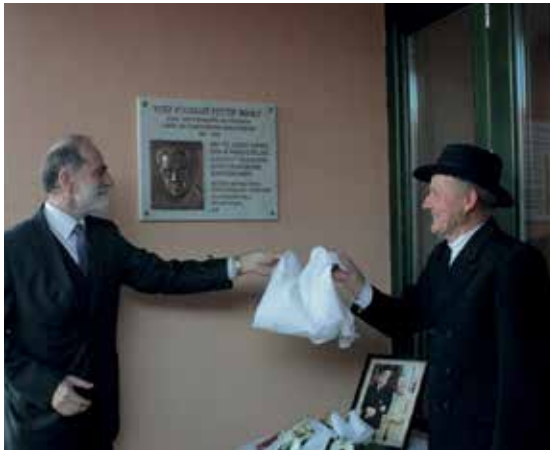
Fogarasy-Fetter Mihály emléktábla-avatás