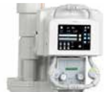
Orvostechnikai eszközbeszerzés (2019)