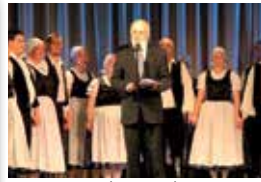
100. éve született Fogarasy Mihály