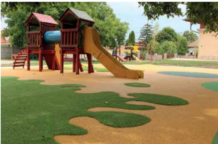
Szabadság utcai óvoda játszóudvar felújítása (2019)