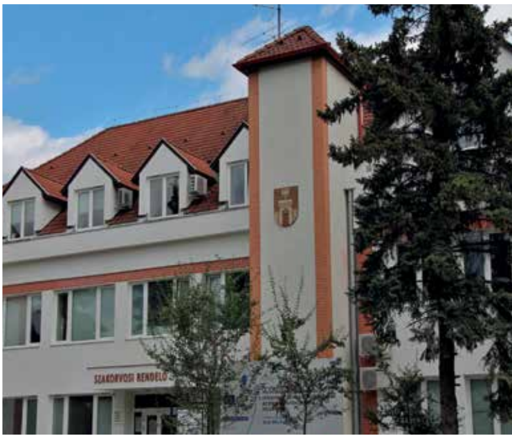
Szakorvosi Rendelőintézet energetikai korszerűsítés (2017)