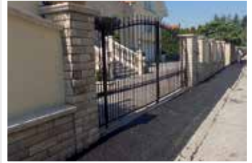
Nyár utca (2017)