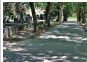
A temető kilenc belső útja (2016, 2017, 2018, 2019)