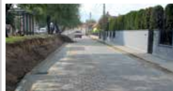
Bányatelepi szervízút mellett (2018)