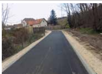
Szent János u.-Tó u.- Tompá M. u. végén (2016)