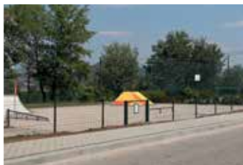
Görgey utca (2019)