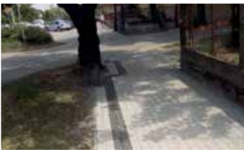
Fő utca bányatelepi szakasza (2017)