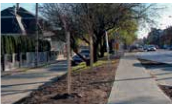
Bányatelepi buszmegálló környéke (2018)