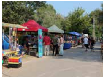
Vörösvári Napok új helyszín (2016)