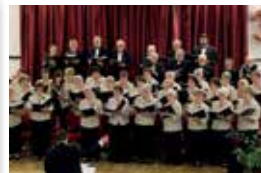
30 éves a Német Nemzetiségi Vegyeskórus