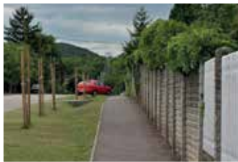
Tavasz utca (2017)