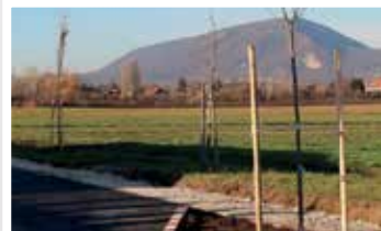
Új fasor a Báthory utcában (2017)