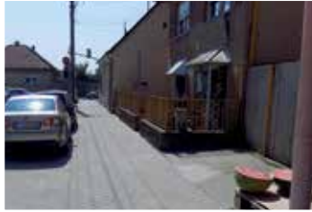
Szabadság utca eleje (2016)