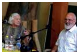
Tuti néni könyvbemutató