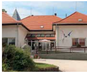
Napos Oldal energetikai korszerűsítés (2017)