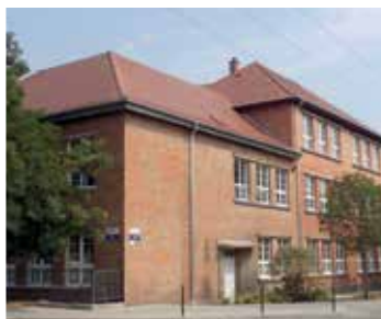
Vásár téri iskola tetőfelújítása (2015)