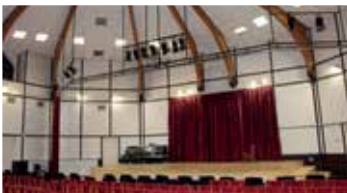
Zeneiskola álmennyezet felújítása (2019)