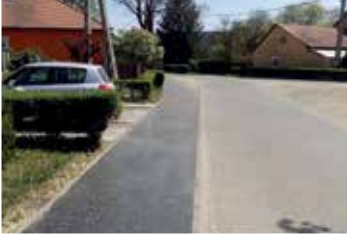
Rákóczi utca (2016)

mintegy 135 millió forint ráfordítással, 14 utcában , összesen 1205 méter szilárd burkolatú járdát építettünk a Fő utcán, a városközpontban, a Bányatelepen, a Szabadságligeten és a Szentiváni-hegy vörösvári oldalán, kiemelten törekedve az óvodák, iskolák és egyéb intézmények, valamint az autóbusz és vonatmegállóhelyek jobb megközelíthetőségét.