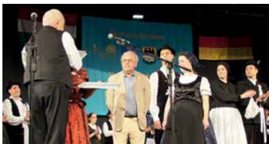
A Német Nemzetiségi Táncegyüttes fennállásának 60. évfordulója