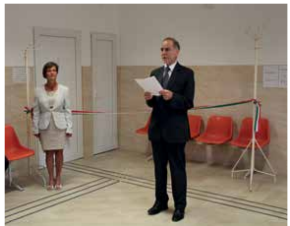
Felújított háziorvosi rendelők átadása