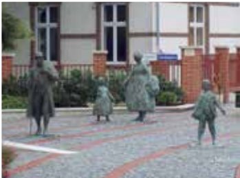
Betelepülési emlékmű és tér (2015)

a pilisvörösvári német nemzetiségi egyesületeket évente 1,8 forinttal , a Német Nemzetiségi Önkormányzatot évente 2,3 forinttal támogattuk. Technikai és ügyviteli segítséget nyújtottunk a Német Nemzetiségi Önkormányzat által szervezett rendezvények megszervezéséhez , fejlesztéseket hajtottunk végre a Lahmkruam Helytörténeti Emlékparkban (hinta, homokozó, díszítő felújítása), támogattuk ill. finanszíroztuk 5 helytörténeti jellegű könyv megjelenését. Kialakítottuk a Vörösvári Napok megrendezéséhez szükséges rendezvényterületet a Városligetben.