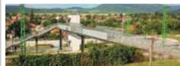
Görgey utcai gyalogos felüljáró (2015)