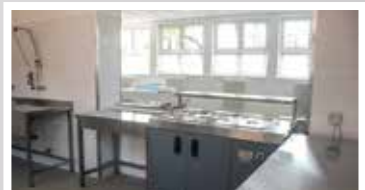
Vásár téri iskola melegítőkonyha felújítása (2019)