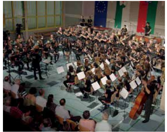
Trina Orchestra koncert - Gerstetten