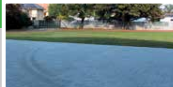
Schiller Gimnázium udvara (2017)