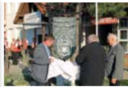
25 éves a Mentőállomás