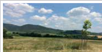
Tanuszoda telek (2018)