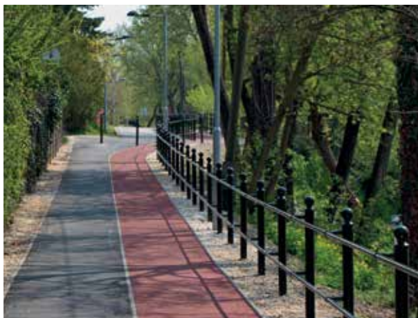
Nagy-tó körüli sétány és futópálya (2018)

szabadtéri tornapályát építettünk a sporttelep sarkában, felújítottuk és lelátóval bővítettük a műfüves pályát , valamint létrehoztunk városunk legnagyobb szabadidős létesítményét, a Nagy-tó körüli sétány és futópályát .