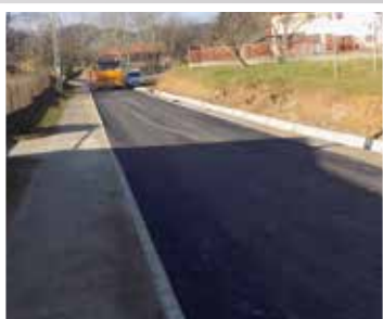
Szikla utca eleje (2016)