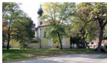
Templom tér (2016)