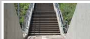
Szabadságligeti gyalogos aluljáró (2015)