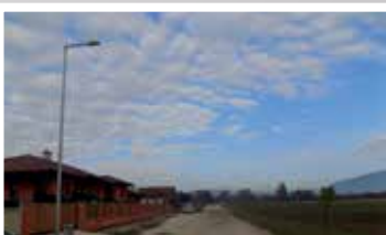
Északi lakóközvet (2016)

Az Északi lakóközvetben 23 darab , a Városligeti sétányon 19 darab , a Nagy-tó körüli sétány és futópálya körül 43 darab kandelábert állítottunk fel, ezen felül a városban elszörtan 36 db lámpatestet szereltettünk fel.