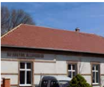
Templom téri kisiskola tetőfelújítása (2015)