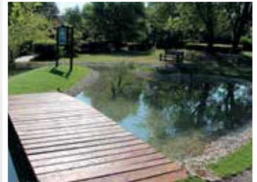
Lahmkruam park tőfelújítás (2019)