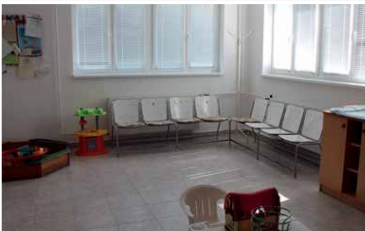
Attila utcai egészségház (Liga) energetikai korszerűsítés (2017), védőnői helyiség felújítása (2018)