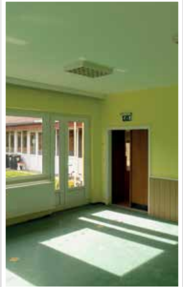
Felújított csoportszoba a Rákóczi utcai óvodában (2015)