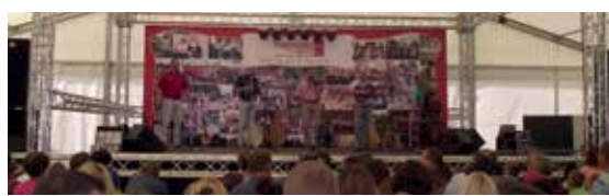
Vörösvári Napok először a Kacs-tónál