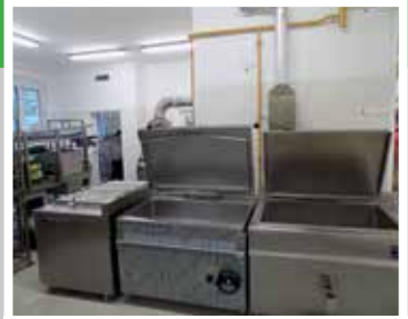
Önkormányzati főzőkonyha teljes felújítása (2016)