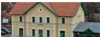
Vasútállomás épületének felújítása (2015)

erőteljes lobbitevékenységgel elértük, hogy a Budapest-Esztergom vasútkorszerűsítés keretén belül régi, eredeti tervei szerint újították fel a vasútállomás és a resti épületét , megépítették a 10-es úti kétszintű csomópontot , a Görgey utcai gyalogos felüljárót és a Szabadságligeti gyalogos aluljárót . Többéves kitarató követeléssel elértük, hogy megépült a modern új posta . Ingyenesen telket biztosítottunk, és minden egyéb adminisztrációs előkészítést megtettünk a tanuszoda megépítéséhez, aminek kiviteli közbeszerzése megindult.