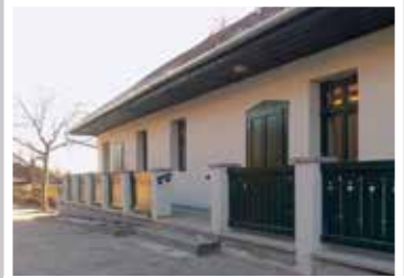
Fizioterápiai rendelő (2017)