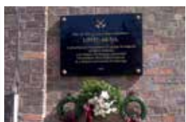
Bányásznak, emléktábla avatás