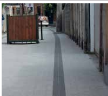
Szent Erzsébet köz (2018)