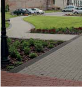
Passázspark kialakítása (postaudvar) (2018)