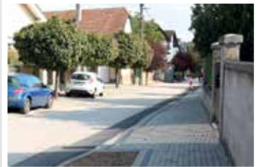
Iskola utca (2018)