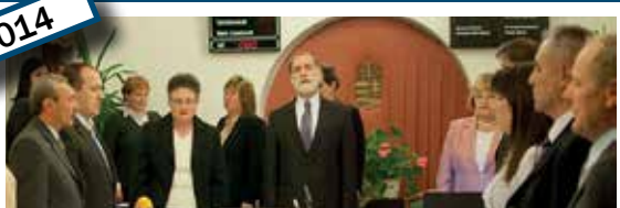
Önkormányzati alakuló ülés