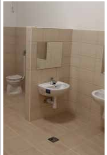
Ligeti Cseperedő Óvoda C épület felújítás (2018)