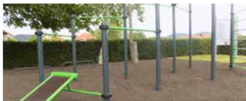
Szabadtéri tornapálya (2016)