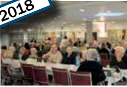
25 éves a Szent Erzsébet Otthon