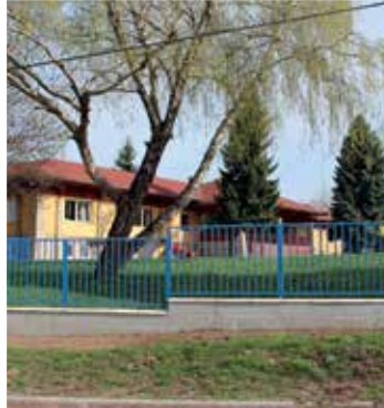
Rákóczi utcai óvoda kerítésének felújítása (2018)