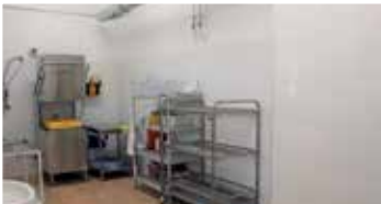
Templom téri iskola melegítőkonyha felújítása (2018)