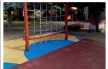
Gradus óvoda udvarfelújítás (2018)