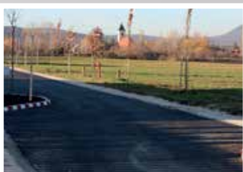
Báthory utca (2017)