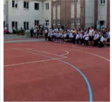
Templom téri iskola sportudvarának kialakítása (2018)