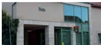
Új postaépület (2016)