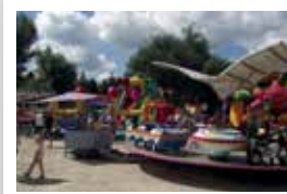
Vurstli először a Kacs-tónál