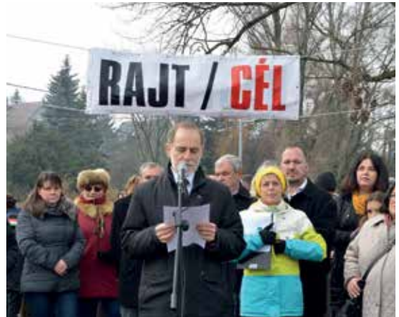
Nagy-tó körüli sétány és futópálya avatása