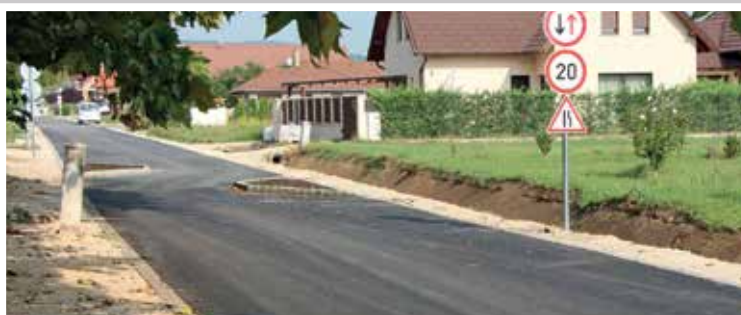
Béke utca (2019)