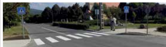
Gyalogátkelő a Kisfaludy utcában (2016)