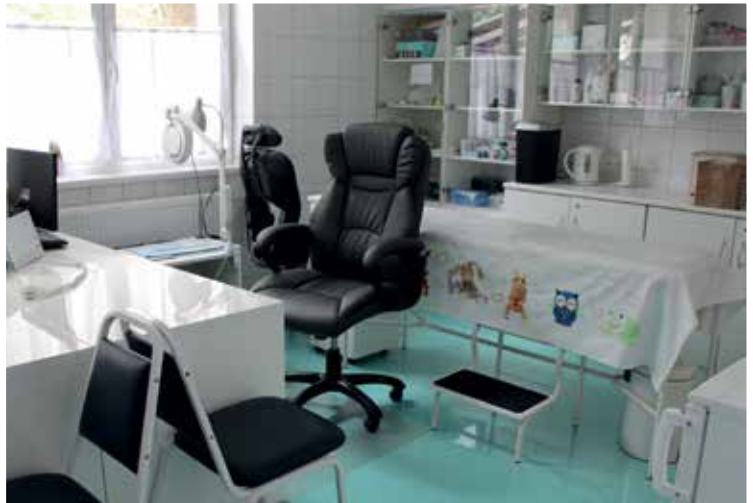
Háziiorvosi rendelők felújítása (2019)