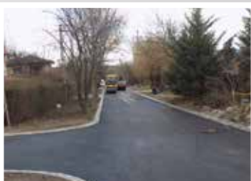
Harcsa u.-Amur u.-Ponty. u. (2015)

290 millió forint ráfordítással, 10 utcában és a temető 9 belső útján , összesen 4767 méter szilárd burkolatú utat építettünk.