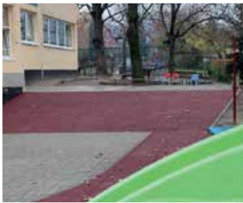
Széchenyi utcai óvoda udvarfelújítás (2017)