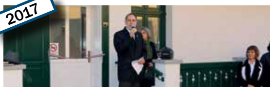
Fizioterápiai rendelő avatóünnepség