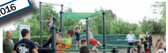
Felnőtt tornapálya avatás