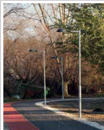
Nagy-tó körüli sétány és futópálya (2018)