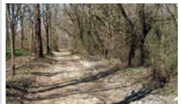
Hulladékgyűjtő akció során megtisztított terület