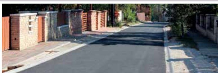
Kálvária utca (2017)