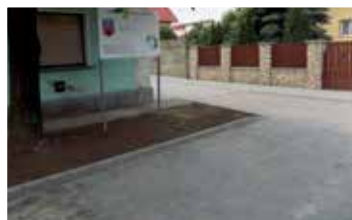
Szent Erzsébet utca (2018)