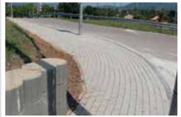
Klapka utca (2019)