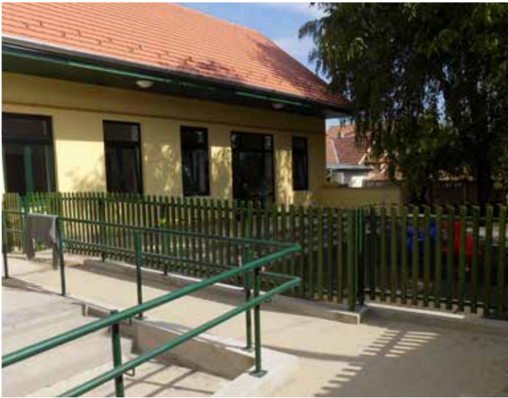
Tipegő bölcsőde (2015)

öt év alatt összesen 375 millió forint értékű intézményfejlesztő beruházást valósítottunk meg, az önkormányzat tulajdonában álló valamennyi intézményépületben történtek jelentős fejlesztések.