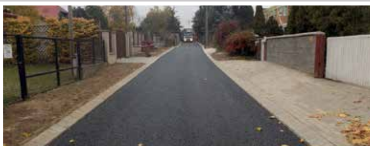
Lahner György utca (2017)