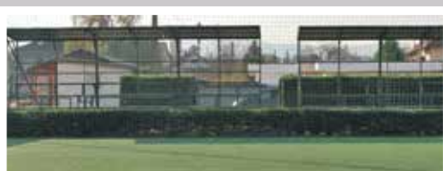
Műfüves pályák felújítása (2017, 2018)