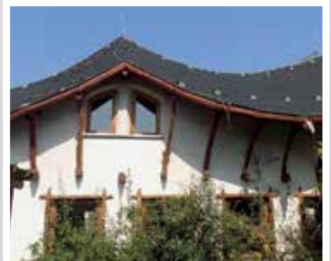
Gradus óvoda tetőfelújítása (2015, 2017)