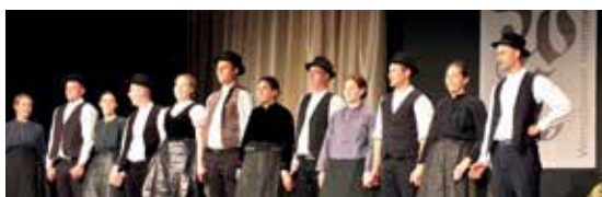
5 éves a Heimatwerk