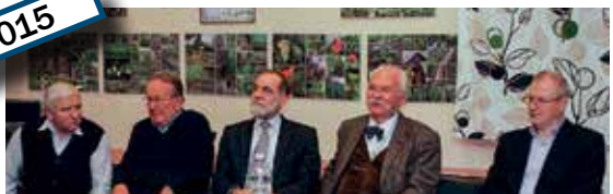
A rendszerváltoztatás 25. évfordulója