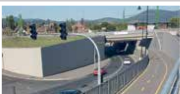
10-es úti aluljáró (2015)