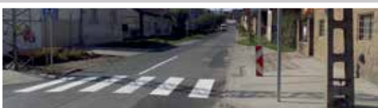
Gyalogátkelő a Csobánkai úton (2016)

a már felsorolt út-, járda-, és parkolóépítésekén túl két kijelölt gyalogátkelőhelyet létesítettünk, egyet a Csobánkai utca-Báthory utca, egyet a Kisfaludy utca-Nyár utca kereszteződésében, valamint egy szalagkorláttal védett járdaszakaszt építettünk a Szabadság u. – Kisfaludy u. kereszteződésében, a kanyarban.