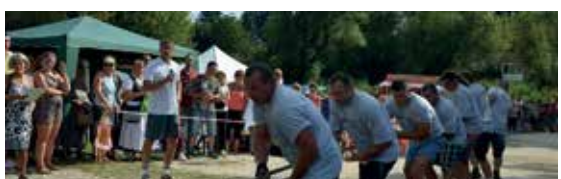
X. Tutajhúzó verseny